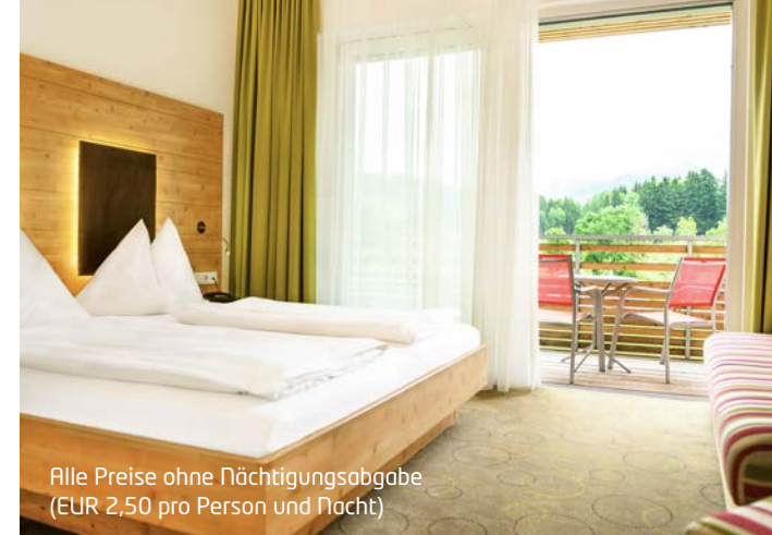
Alle Preise ohne Nächtigungsabgabe (EUR 2,50 pro Person und Nacht)

5=4 Nächte im Sturzhahnzimmer € 386 / Erw.