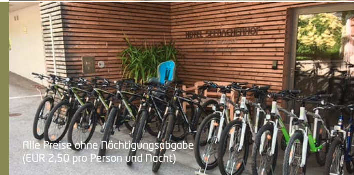
Alle Preise ohne Nächtigungsabgabe (EUR 2,50 pro Person und Nacht)

Pauschalpreis im Zimmer Sturzhahn € 362 / Erw.