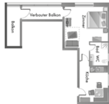
Appartement 2 35 m 2 - 2 bis 3 Personen